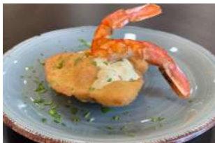
— TAPA 1 — PANI PURI DE LA LONJA

Panecillo indio frito de gambones de la lonja al curry