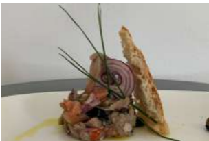
— TAPA 2 — AY KARMELA

Salmorejo casero con aguacate, salmón y frutos secos