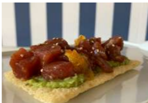
— TAPA 2 — CAPRICHIO DE ATÚN

Bocado de cocina casera a base de sepias rebozadas con mayonesa de cilantro