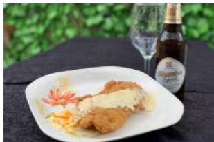
— TAPA 1 — CACHOPO TERRA & MAR

Lomo de cerdo con beicon y queso, en empado y salsa de queso