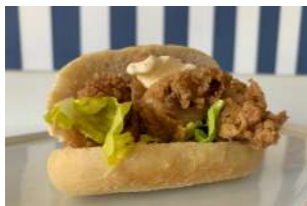
— TAPA 1 — BOCADO DE SEPIA

Bocado de cocina casera a base de sepias rebozadas con mayonesa de cilantro