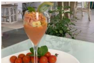
— TAPA 1 — CUATRO ESTACIONES

Salmorejo casero con aguacate, salmón y frutos secos