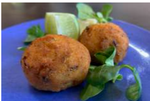
— TAPA 2 — CROQUETAS MORUNAS

Panecillo indio frito de gambones de la lonja al curry