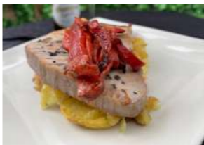
— TAPA 2 — TRES ALTURAS

Lomo de cerdo con beicon y queso, en empado y salsa de queso