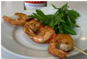
— TAPA 2 — BROCHETA

Brocheta de langostinos con tomate cherry.