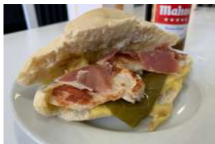
— TAPA 1 — ESPECIAL

Serranito de lomo, pimienta, queso y jamón.